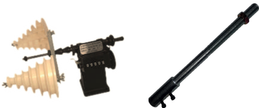
Image Bobineuse manuelle avec compte-tours analogique BOZ1