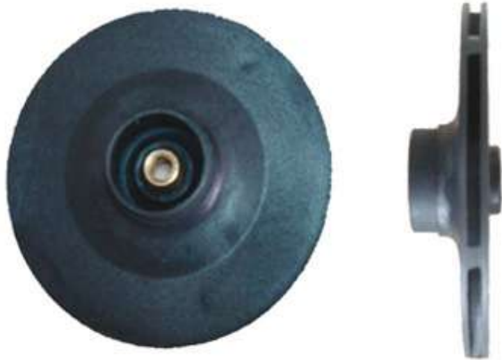
Schéma Turbines coniques épaulée CNEP : T130 , T130 H6

Image Turbines coniques épaulée CNEP : T130 , T130 H6