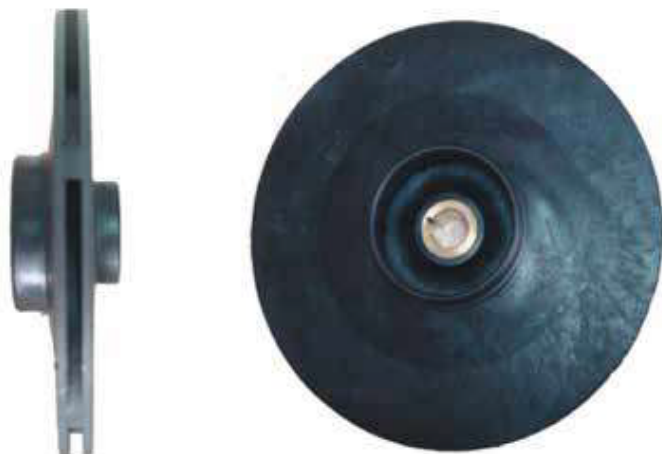
schéma CEP : T200 M , T200T , T300